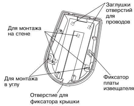
Рисунок 2 – Основание извещателя

Примечание – Для надежного исключения ложных срабатываний от домашних животных, не рекомендуется, при установке извещателя, отклонение его положения от вертикали более чем на 2°.