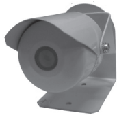
«ИПП-Ех» исполнение 1