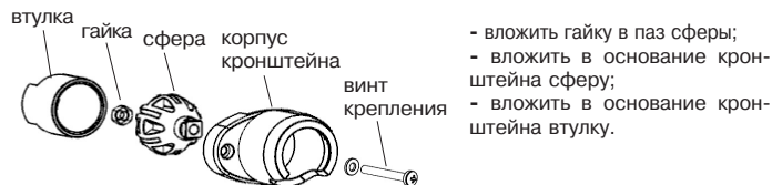
Рисунок 3 – Детали кронштейна

10.1 Собрать прилагаемый в комплекте кронштейн: