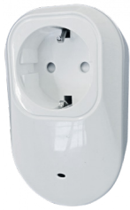
Этикетка БФЮК.425412.013-02 ЭТ